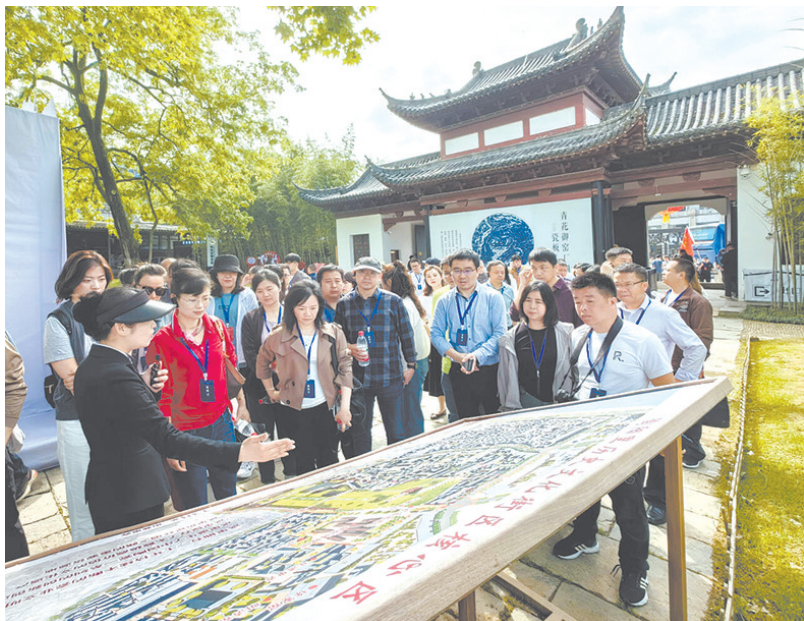
▲媒体记者们参观陶阳里历史文化街区。